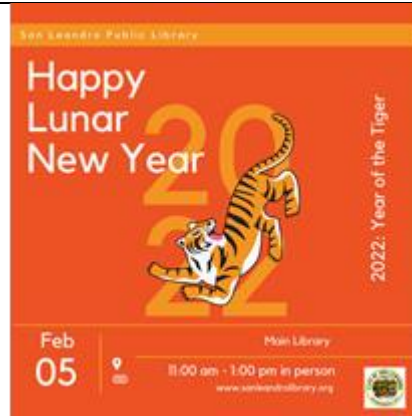
農曆新年慶祝活動 2月5日(週六)上午11時-下午1時 總圖書館的戶外活動(若天氣允許)

參加由聖利安住歷史博物館 (San Leandro History Museum) 職員每月舉辦的 Zoom 讀書會。活動開放給所有有興趣的成年人參加，一起討論書本。本月的 Zoom 讀書會開放給所有有興趣討論書本的成年人參與。不愛歷史小說書籍？我們歡迎所有讀者（不論書籍類型和興趣）加入我們，討論他們正閱讀的書籍，或者只是來聊天，從社區中的其他參與者獲得一些推介。本讀書會沒有任何要求，你可以只來一次或定期出席，即使不是讀者或只想前來聽聽他人討論其正在閱讀的書籍，也都歡迎！（ 請報名參加以獲取 Zoom 會議連結 ）