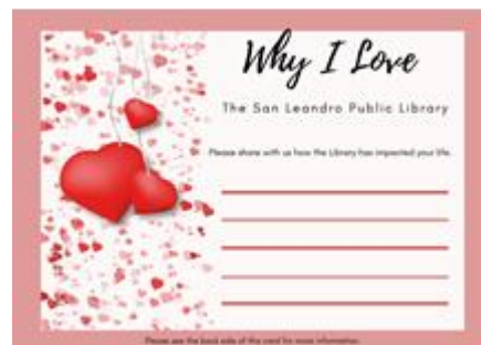
愛上聖利安住圖書館的理由 2月1-28日

為慶祝充滿愛的月份，請索取一張「愛上聖利安住圖書館的理由」(Why I love the San Leandro Library) 明信片，在上面寫下聖利安住圖書館如何影響你的生活，然後交回總圖書