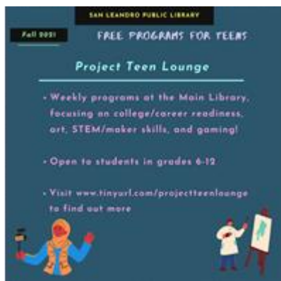
青少年休閒活動室：每逢星期二、三、四 總圖書館的現場活動

請和我們一起慶祝農曆新年 – 虎年！我們準備了音樂、手工藝品、武術和舞獅表演，精彩可期！